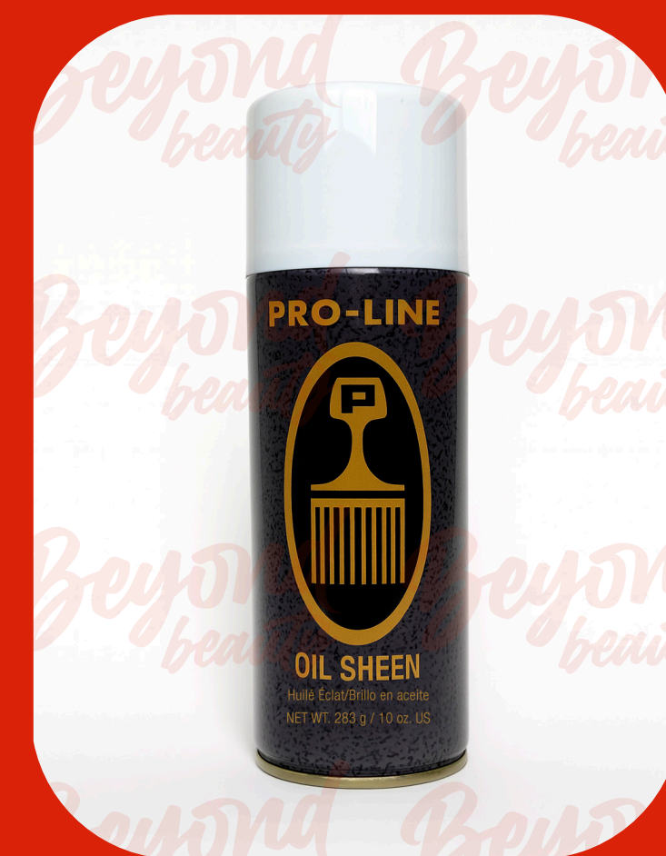
BRILLO EN ACEITE