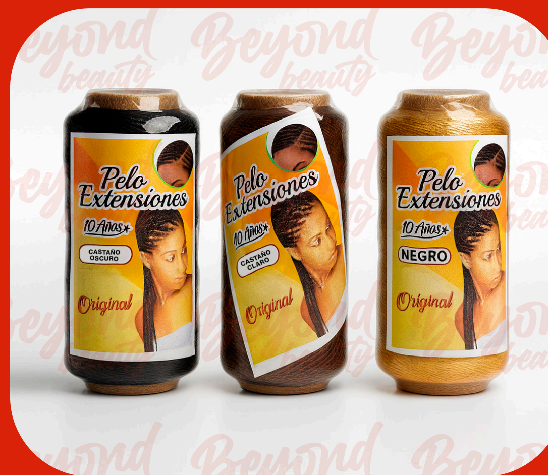
CABELLO EN TUBO