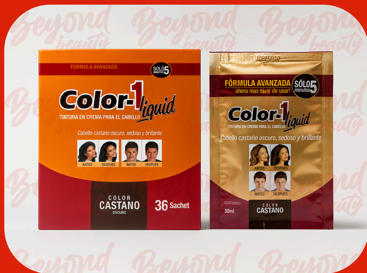
TINTURA EN CREMA